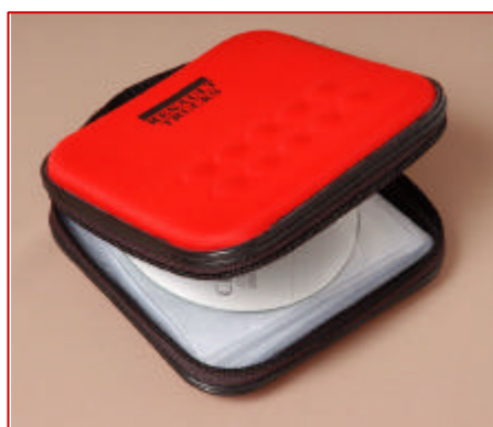
PORTA CD ROJO